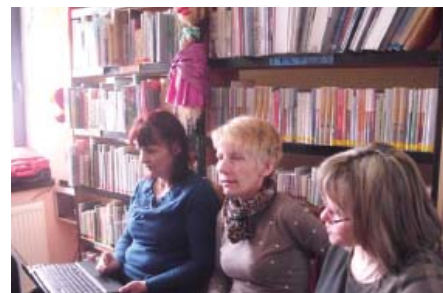
Uczestnicy zajęć komputerowych