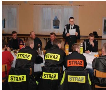
Zebrań sprawozdawcze w Jelonkach

z czego 30 stanowiły pożary, a 28 miejscowe zagrożenia: wypadki i kolizje drogowe, lokalne podtopienia, zwalone pnie drzew, usuwanie gniazd os i szerszeni. Odnotowano 2 fałszywe alarmy. Druhowie zabezpieczali także uroczystości kościelne, pomagali w organizowaniu Dożynek Powiatowych w Rychlikach