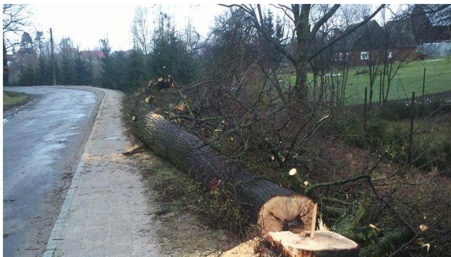
Wycinka drzew

Termin wycinki drzew niezasiedlonych przez owady chronione upłynął 15 marca, do 15 maja potrwa wycinka drzew zasiedlonych m.in. przez pachnicę dębową. Wynika to przede wszystkim z konieczności zachowania odpowiedniej temperatury podczas przenoszenia i wsiedlania okazów w inne miejsca.